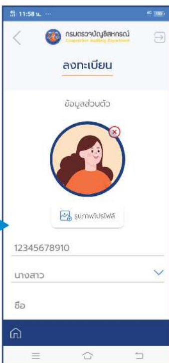
จะปรากฏข้อมูล บุคลากร กตส. กรอกข้อมูลเพิ่มเติม