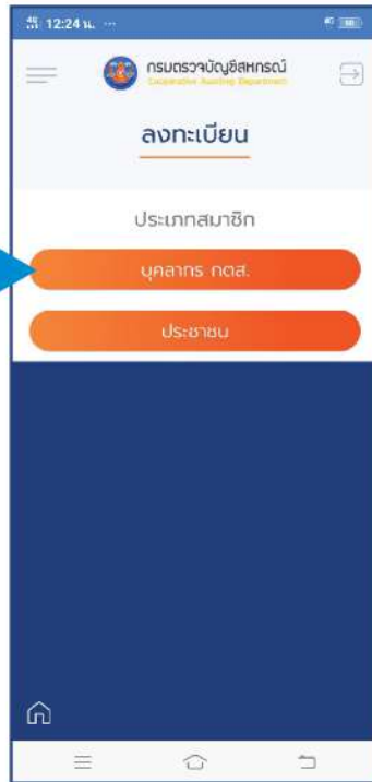
เลือก บุคลากร กตส.