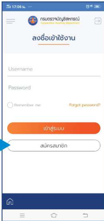
คลิกปุ่มสมัครสมาชิก