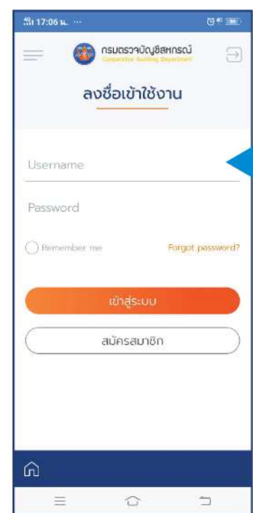
ใส่ข้อมูลชื่อผู้ใช้และรหัสผ่านเพื่อเข้าระบบ