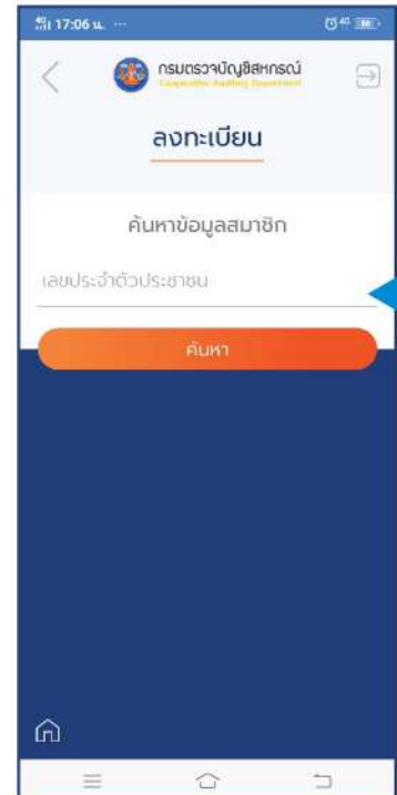
กรอกหมายเลขประจำตัวประชาชน