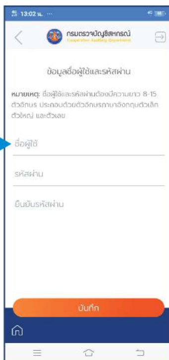
กรอกข้อมูลชื่อผู้ใช้และรหัสผ่าน